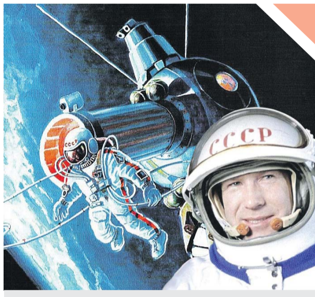
Алексей Леонов на фоне своей картины «Выход в открытый космос. 25.03.1965 г.»

30 мая исполняется 90 лет со дня рождения дважды Героя Советского Союза Алексея Архиповича Леонова – лётчика-космонавта, впервые в мире вышедшего в открытый космос