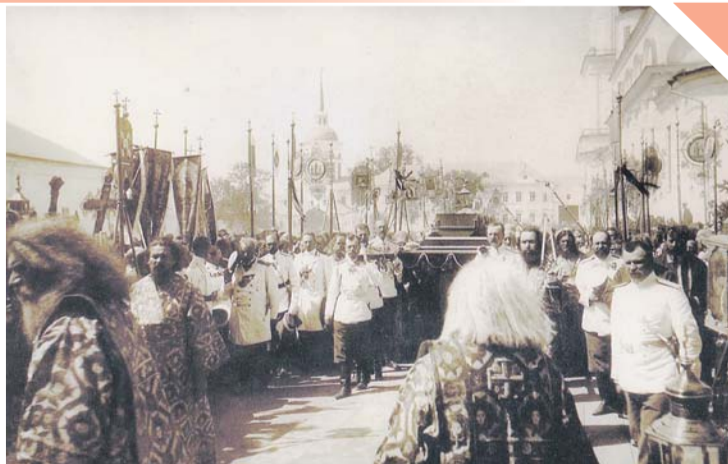
Торжественная процессия с мощами преподобного Серафима Саровского, возглавляемая императором Николаем II, 1903 г.

Провели исследование и на основании православного вероучения пришли к выводу, что нетление мощей не является необходимым условием прославления святых угодников. Нетление, когда оно есть, – чудо, но только