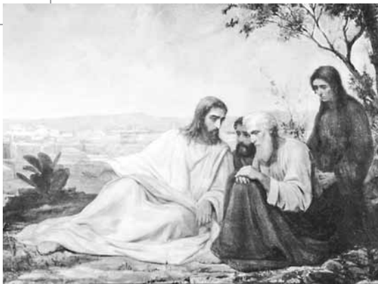
Боткин М.П. «Беседа Христа с учениками» (1867)

мстить им. Мсть была ветхозаветным обычаем, но этот обычай заменён новой заповедью: «любите врагов ваших, благословляйте проклинаящих вас, благотворите ненавидящим вас и молитесь за обижающих вас и гонящих вас» (Мф. 5: 44).