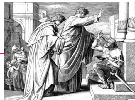
Исцеление хромого апостолами Петром и Иоанном

День Святой Троицы – особый и для истории Церкви, и для жизни каждого христианина! В этот день апостолы получили дар Святого Духа – ту реальную силу, что прикоснулась к ним – слабым, немощным, грешным. Которые часто не могли понять того, что говорит им Спаситель, тем более не могли повторить Его чудес, испугались Его ареста и разбежались в момент Его крестных страданий.