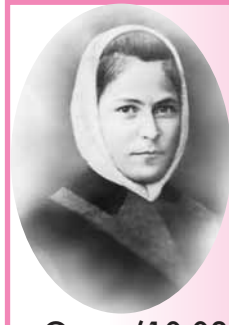
Ольги (10.02.1938) и Димитрия (17.02.1938).

В феврале исполняется 75 лет со дня кончины святых мучеников Жуковских