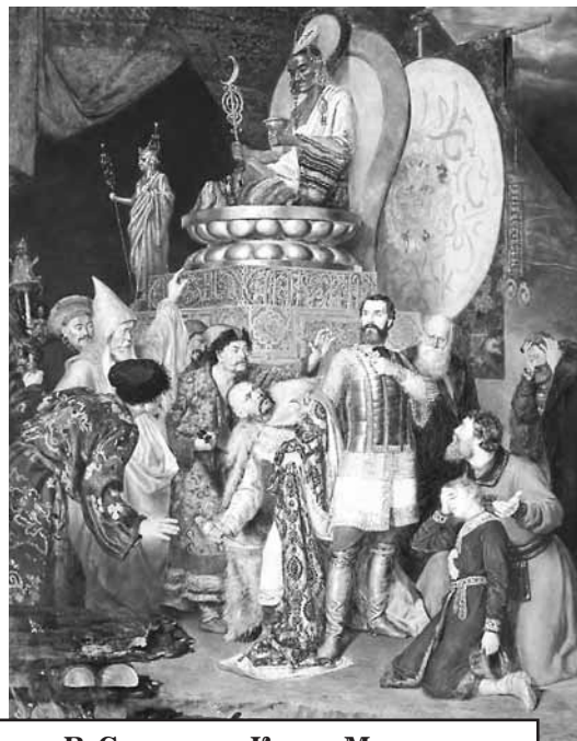
В. Смирнов. «Князь Михаил Черниговский перед ставкой Батыя»

Тела святых страстотерпцев были брошены палачами на съедение псам, но Господь чудесно сохранил