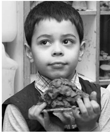
Кружок лепки в школе №15