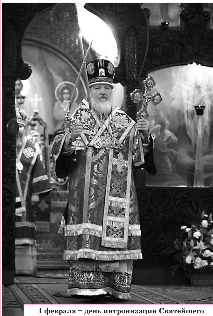
1 февраля – день интронизации Святейшего Патриарха Московского и всея Руси Кирилла