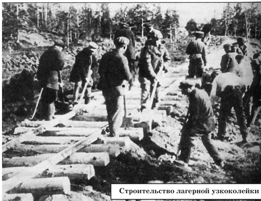
Строительство лагерной узкоколейки

ную табличку и по ней, как слепец, руками вода, прочёл: «Авва Герман».