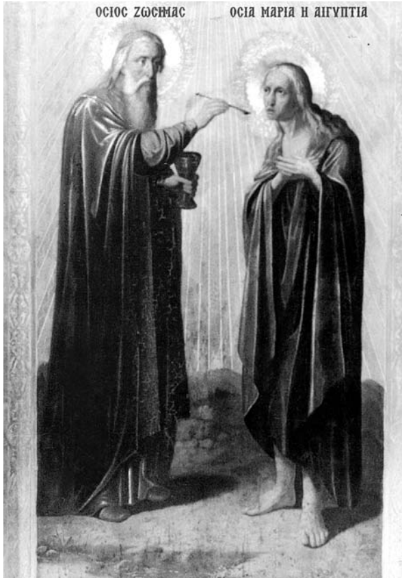
Икона из лавры прп. Герасима

Раньше вообще люди были более простодушны. Они истину евангельскую воспринимали прямо, буквально. Мария входила в храм, чтобы поклониться Кресту Господню, Животворящему Древу, и никак не могла войти: Господь не попускал. Когда у нас в жизни что-то не получается, мы обычно начинаем винить всех вокруг: людей, обстоятельства, власти, ещё что-то... Она же восприняла это совершенно правильно: она поняла, что её не пускает её собственный грех. А желание прикоснуться к Древу было огромное, и Мария решила помолиться Богородице и дать обет, что, если Пречистая Дева её допустит в храм, тогда она свою жизнь переменит. И была допущена тут же, и прикоснулась к Древу Животворящего Креста, и причастилась на