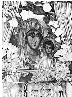
Икона, пред которой молилась прп. Мария Египетская

Это её решение есть покаяние. Мария пошла в пустыню и там, конечно, очень тяжело страдала. Она терпела голод, жажду, а помимо этого мучилась от помыслов, от своих желаний, от страстей, которые её терзали, но всё-таки в мир не вернулась. Она бросалась на землю, грызла песок, рвала на себе волосы, била себя в грудь, она не спала, молилась – но не переступила Иордан, назад не пошла. Вот такое мужество показала и такое великое терпение. Она терпела саму себя, свои страсти, не давала им воли до тех пор, пока они не умерли. И когда страсти умерли, она стала восходить на духовную высоту и достигла удивительной святости, абсолютной прозорливости, полного знания Священного Писания.