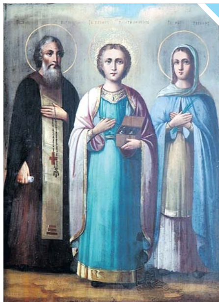
Икона священномученика Ермолая, великомученика Пантелеимона и святой Еввулы Никомидийской

После смерти матери отрок рос и укреплялся духом. Однажды ему встретился старец Ермолай. Когда он стал говорить юноше о Господе,