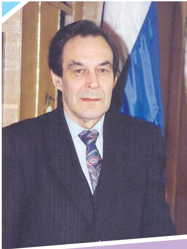
Роберт Николаевич Овсянников (28 апреля 1939 г. – 29 июня 2018 г.)

Я всегда с теплотой и глубокой признательностью вспоминаю Роберта Николаевича Овсянникова, доброе имя которого осталось не только в истории города Жуковского, но и в моей судьбе.