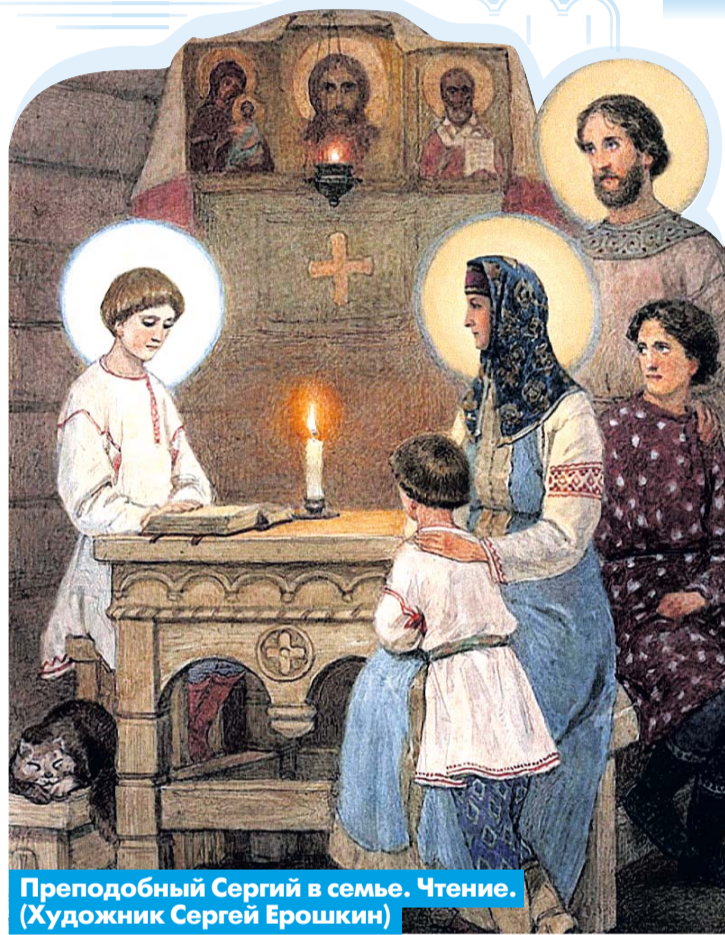
Преподобный Сергий в семье. Чтение. (Художник Сергей Ерошкин)

В связи с началом учёбы и связанными с ней трудностями хочется вспомнить и нашего великого русского святого – преподобного Сергия Радонежского. Из его жития мы видим, что ему в юном возрасте невероятно тяжело давалось учение. Он очень переживал из-за этого