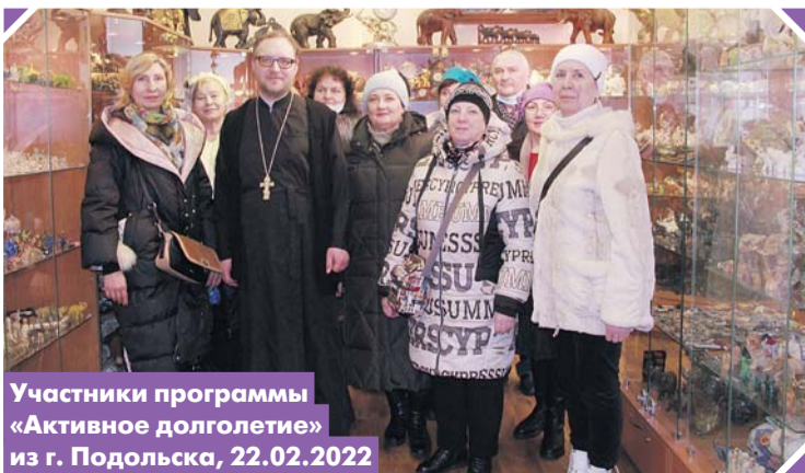
Участники программы «Активное долголетие» из г. Подольска, 22.02.2022

Первым выполнил все фигуры высшего пилотажа на реактивных самолётах и первым испытал все виды вооружения на них.