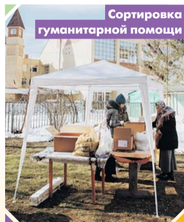
Сортировка гуманитарной помощи