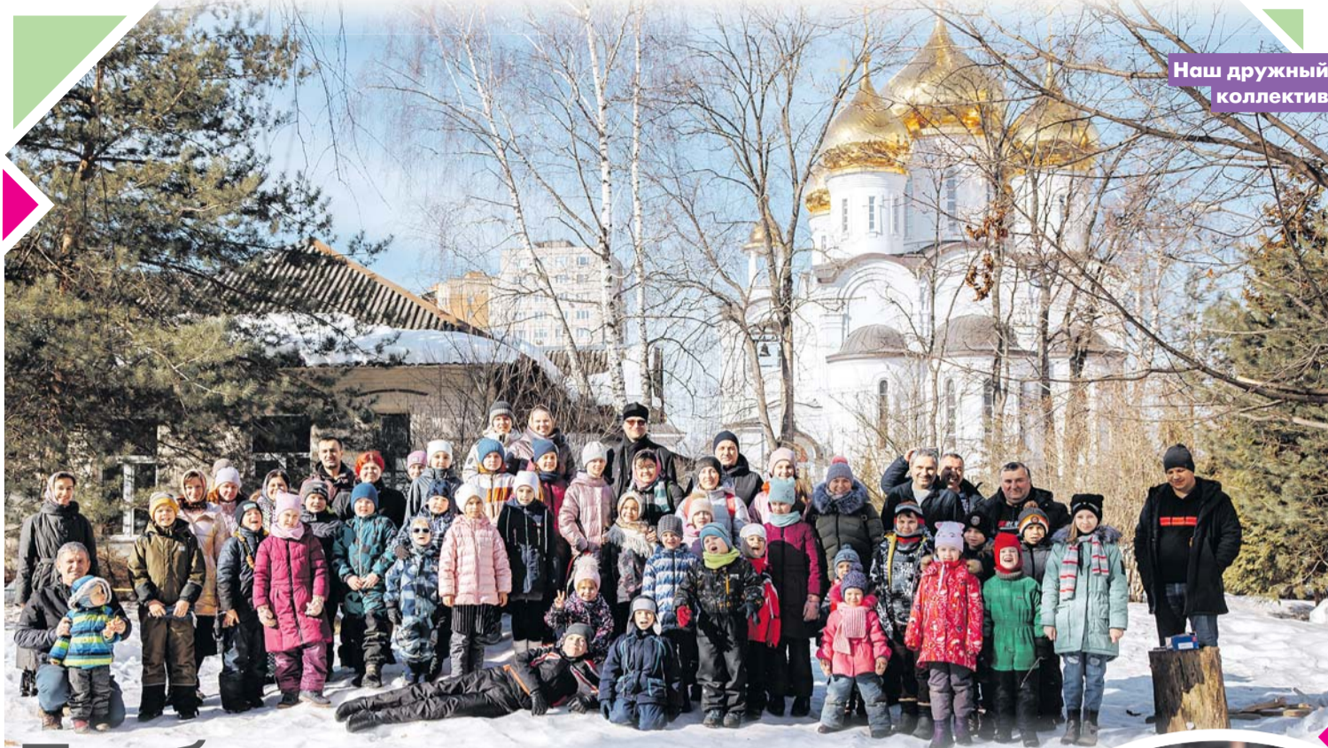
Наш дружный коллектив