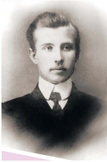
17 февраля – память мученика Дмитрия Ильинского, Жуковского