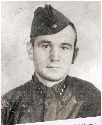
ТИТАЕВ (1922 – 1942 гг.)