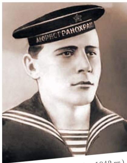
ГОЛУБЕЦ (1916 – 1942 гг.)

Бросился Голубец на катер. Пробился сквозь огонь. Подбежал к рычагам сбрасывателей. Ухватился. Нажал. Вот сейчас рухнут бомбы.