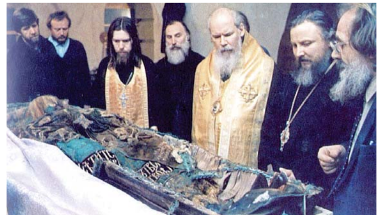
Обретение мощей Патриарха Тихона в Донском монастыре