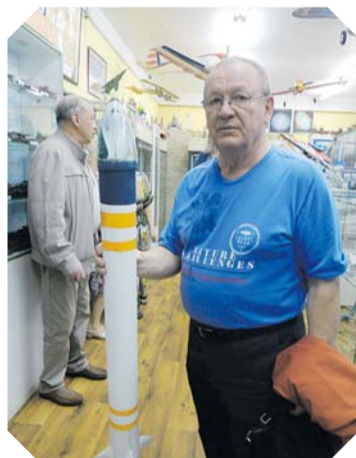
Германа Титова р.п. Коченёво Новосибирской области.

После ознакомления с экспозицией директор Музея авиации и космонавтики имени Германа Титова,