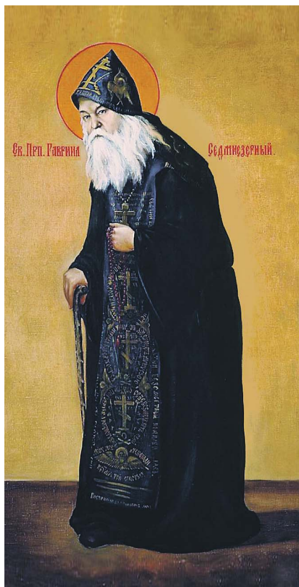
Св. Прп. Гавриил