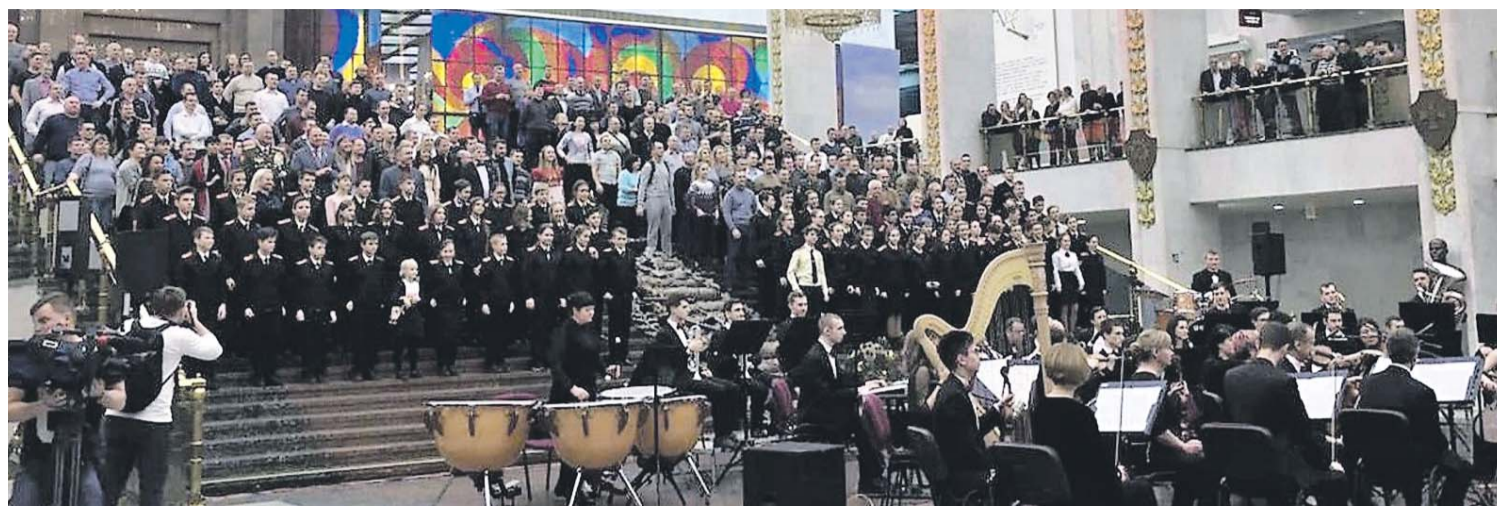
В честь 80-летия «Катюши» в Музее Победы на Поклонной горе 700 человек приняли участие в исполнении песни

Совсем по-иному зазвучала «Катюша» в военные годы. Бойцы не только знали на-