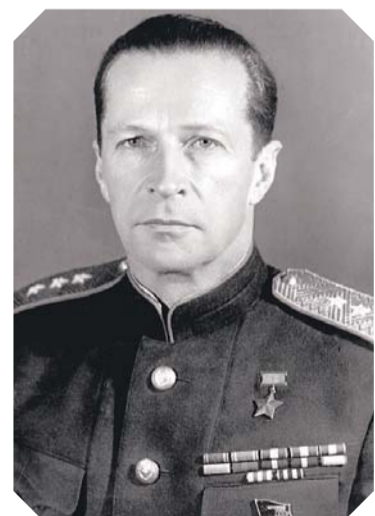
Михаил Михайлович Громов

Летом 1933 г. экипаж Громова впервые испытал шестимоторный тяжёлый бомбардировщик ТБ-4 (АНТ-16), а в конце 1936 г. Громов поднял в воздух «летающую крепость» АНТ-42 (Пе-8). Это были достижения мирового уровня!