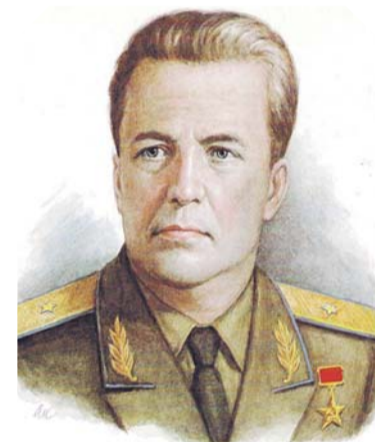
Владимир Михайлович Мясищев

Благодаря деятельности В.М. Мясищева был сделан колоссальный скачок в развитии отрасли. «И это всё, – восхищённо говорил Бюшгенс, – зон «прошибал» совершенно мгновенно. Значимая фигура! Его уже внимательно слушали в высоких кабинетах. Он, бывало, звонил по «кремлёвке»: «Я – Мясищев! Завтра к вам приедет мой заместитель и доложит о таких-то и таких-то наших проблемах...»