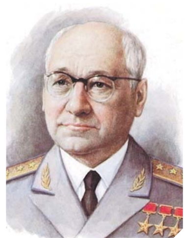
Андрей Николаевич Туполев