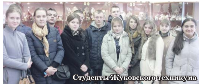
Студенты Жуковского техникума