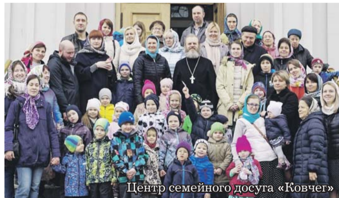
Центр семейного досуга «Ковчег»