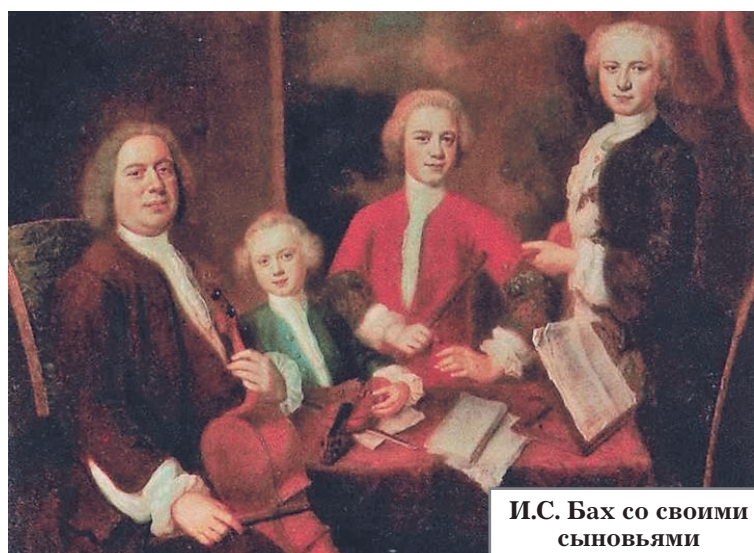
И.С. Бах со своими сыновьями

2. Смысловая трактовка тональностей (например, тональность до мажор избиралась для произведений, посвящённых самым чистым и светлым образам: первая прелюдия в до мажоре, которой открывается «Хорошо темперированный клавир» (ХТК) Баха, посвящена Благовещению Пресвятой Богородицы).