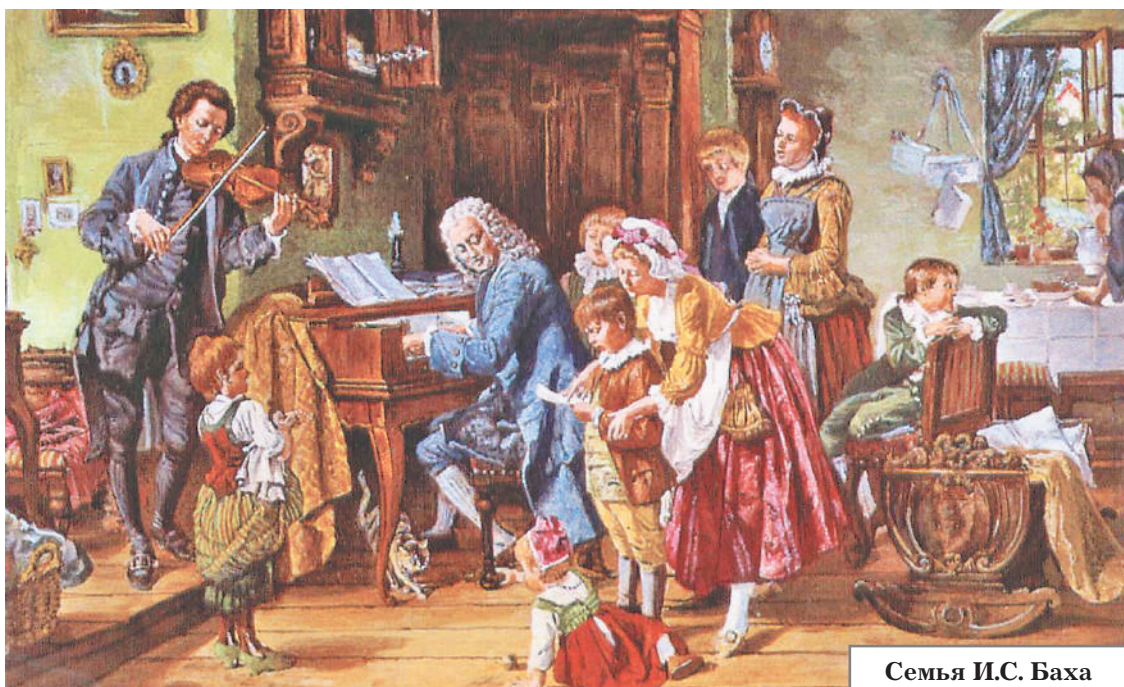
Семья И.С. Баха

зыкальной гильдии, и считалось, что дети, появляющиеся в семье, тоже должны были в неё вступить.