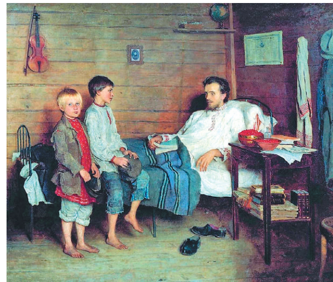
Н. П. Богданов-Бельский «У больного учителя»

и старался создавать все условия для развития их талантов.