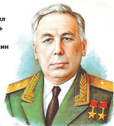
С.А. Лавочкин (1900–1960)

Долгое время имя С.А. Лавочкина было секретно из-за его профессии конструктора. И до сих пор многое из того, что он сделал, остаётся тайной.