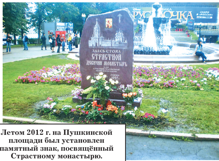
Летом 2012 г. на Пушкинской площади был установлен памятный знак, посвящённый Страстному монастырю.