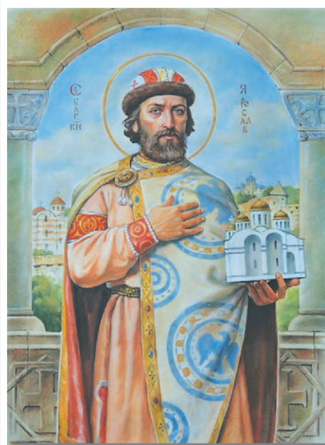
Ярослав Мудрый. Худ. А.О. Орленов

Х ристианская Церковь становится просветительницей новокрещёного государства, и в этом её поддерживает великокняжеская власть. Летописец сравнивает князя Владимира с пахарем, который «распахал сердца людей, просветив их крещением», а его сына Ярослава – с сеятелем, который «засеял их книжными словесами».