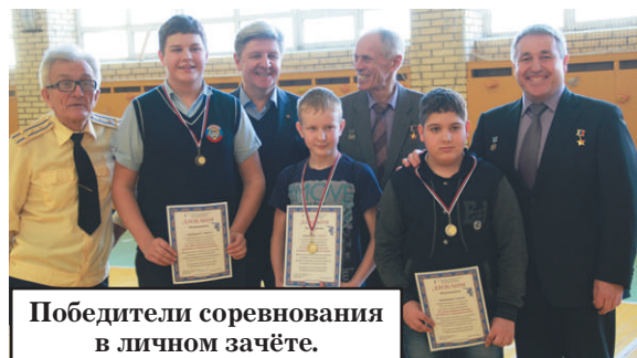
Победители соревнования в личном зачёте.