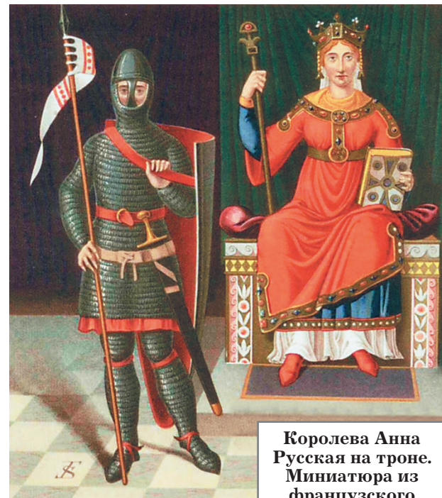
Королева Анна Русская на троне. Миниатюра из французского манускрипта XI в.

Просветительская деятельность Ярослава простиралась не только на столицу, но и на всю Русь. Яро-