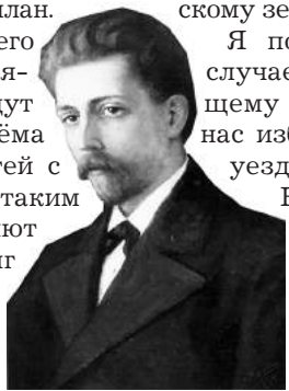
Николай Дмитриевич Телешов (1867-1957), русский писатель и поэт, создатель музея Московского художественного театра, потомственный почётный гражданин Москвы.