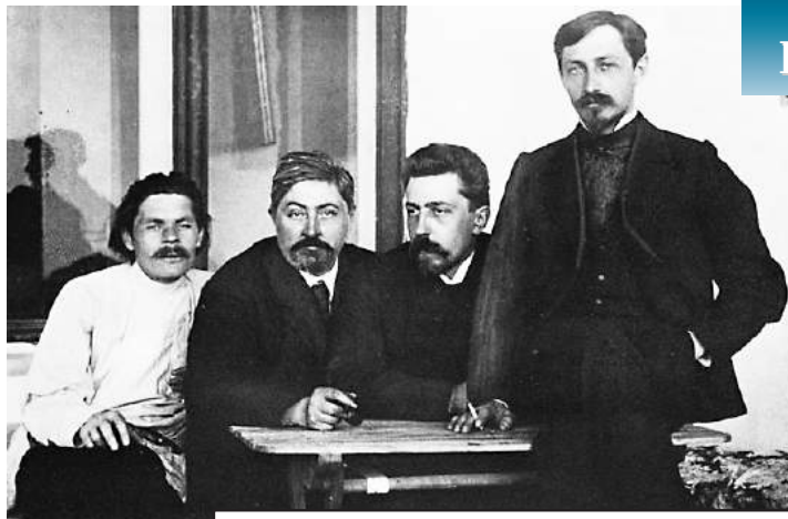
Слева направо: Максим Горький, Дмитрий Мамин-Сибиряк, Николай Телешов и Иван Бунин. Октябрь 1900 г.