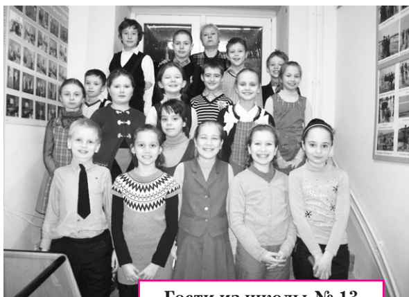
Гости из школы № 13

13 февраля 2015 г. Пантелеимоновский приход посетили уча-