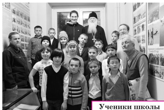
Ученики школы № 11 на приходе

20 и 21 января учащиеся 4«А», 3«А», 3«Б», 2«А» классов школы № 11 г. Жуковского посетили музей и авиамodelьные кружки Пантелеимоновского прихода.