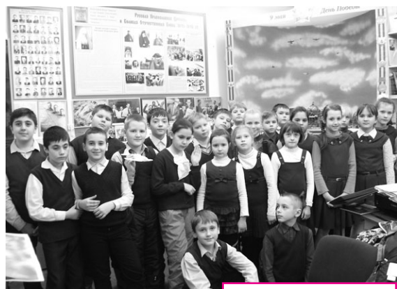
Гости из школы № 25

После посещения храмов, музеев, мастерских и кружков воскресной школы в авиамodelьном кружке для мальчиков прошёл мастер-класс по изготовлению модели самолёта, а в мастерской художественных ремёсел для девочек – мастер-класс по рукоделию.