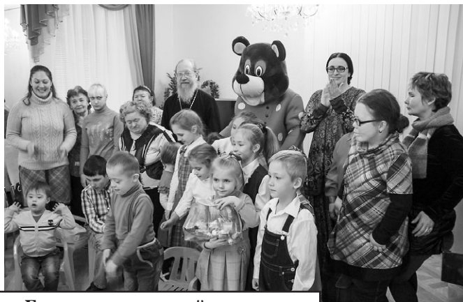
Благотворительный концерт в «Радуге» для детей-инвалидов

В рамках акции Московской епархии «Согреем детские сердца» в Жуковском благочинии в конце октября прошло несколько важных мероприятий.