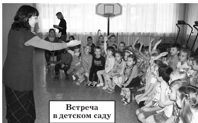
Встреча в детском саду