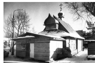
Храм святого Пантелеимона в 1996 году.

30 декабря исполняется 20 лет со дня основания Пантелеимоновского прихода