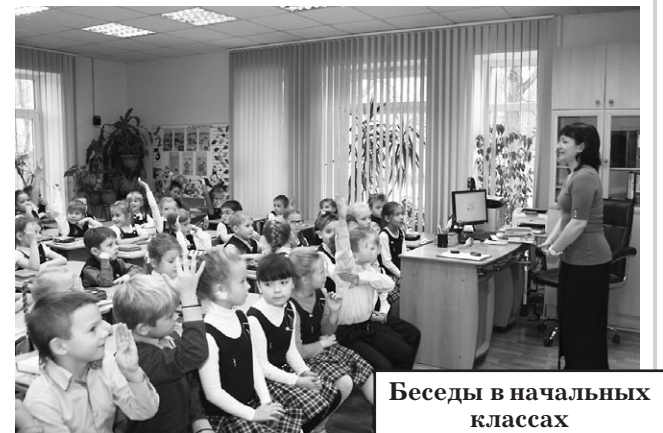
Беседы в начальных классах