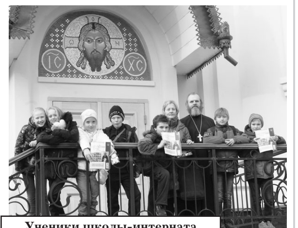
Ученики школы-интерната на Пантелеимоновском приходе