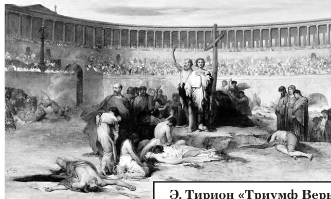
Э. Тирион «Триумф Веры – христианские мученики во времена Нерона, 65 год н.э.»

Но не только подобные факты приводили многих к христианской вере. История сохранила многочисленные факты, свидетельствующие о том, с какой силой действовала в то время благодать Божия в христианах. Одним прикосновением руки христианина, одним его словом исцелялись неизлечимые болезни, становились здоровыми калеки, бесноватые, психически больные. Таких фактов было множество: где появлялись христиане, чудеса совершались постоянно, и это, естественно, молниеносно распространялось среди народа безо всякого радио и телевидения.