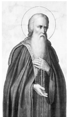
Преподобный Андроник Московский

О некоторых из них наш сегодняшний рассказ.