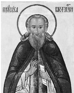
Преподобный Савва Сторожевский

Преподобный Савва был одним из первых и ревностных учеников преподобного Сергия. Последний лучше других видел успехи преподобного Саввы в духовной жизни и поставил его духовником всей братии монастыря.