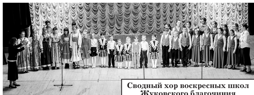
Сводный хор воскресных школ Жуковского благочиния

По сложившейся вот уже в течение 14 лет традиции 5 мая в жуковском городском Дворце культуры состоялся праздничный концерт, посвящённый Неделе святых жен-мироносиц.