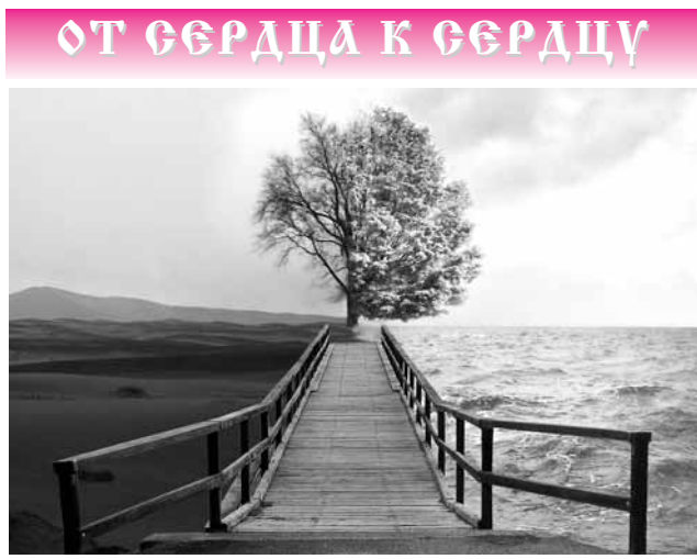
ОТ СЕРДЦА К СЕРДЦУ