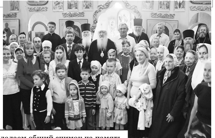
«Сделаем общий снимок на память о нашей встрече!» – сказал Владыка.