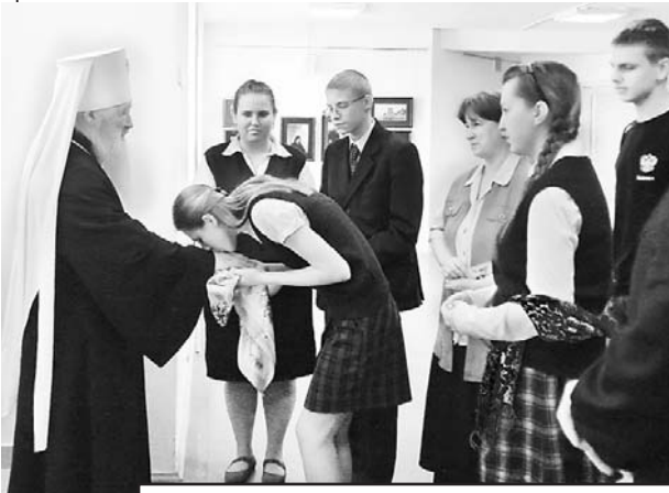
За благословением на учёбу.