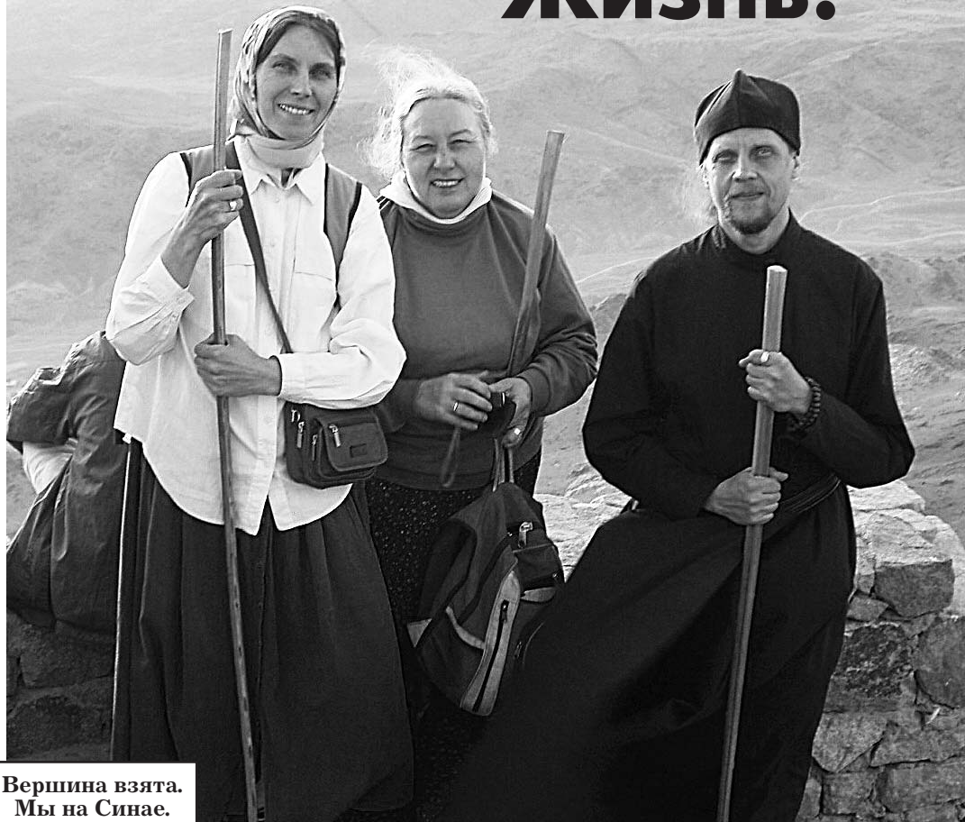
Вершина взята. Мы на Синае.

греческих молитв и песнопений были непонятны, но дух праздника объединял всех! Особенно во время пения «Верую!» Казалось, что горы сотрясались: десятки тысяч людей произносили эту молитву на своём языке, но все понимали, что пели одну молитву. Мы, русские паломники, конечно, молились за наших родных, ближних, за нашу Россию с верой в её духовное преображение, ибо только вера способна возродить нашу многострадальную Родину и привести русский народ к его подлинному величию.