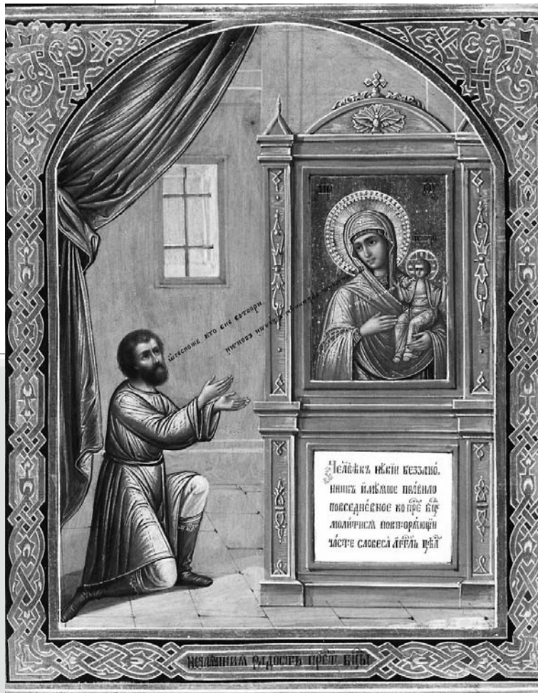
Икона Божией Матери «Нечаянная Радость»